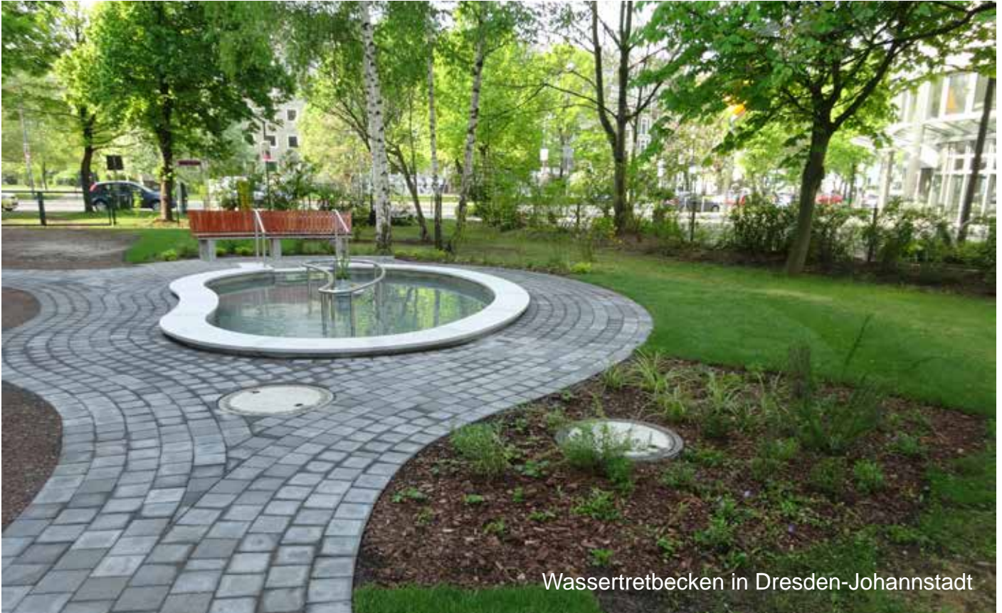
Wassertretbecken in Dresden-Johannstadt

Der Kneipp-Verein Dresden e. V. hat nach umfangreicher Recherche eine Übersicht der zur Zeit in Sachsen bestehenden Kneippanlagen erarbeitet. Das Dokument informiert über die regionale Verteilung der Anlagen und beschreibt jede der Anlagen mit Angaben zu Art, Lage, Nutzungsmodalitäten sowie Kontaktmöglichkeiten.