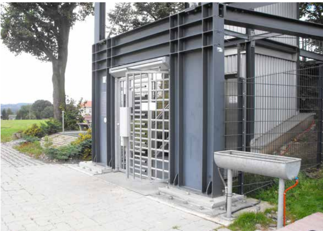
Wasserarmbecken, rechts im Bild

Hinweise: zur Anlage gehört auch ein barrierefrei zugänglicher Aussichtsturm mit Panoramablick auf das Elbsandsteingebirge